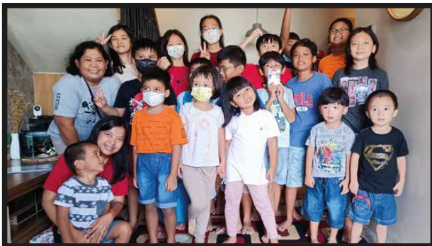
BIA Lingkungan Barnabas