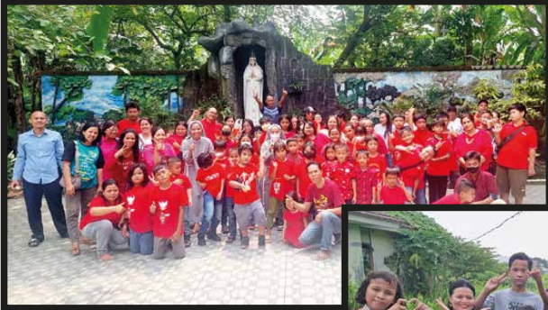
BIA Lingkungan Barsilius Agung