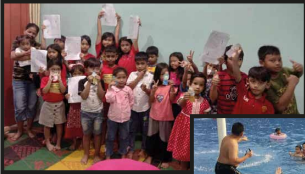
BIA Lingkungan Louisa de Marillac