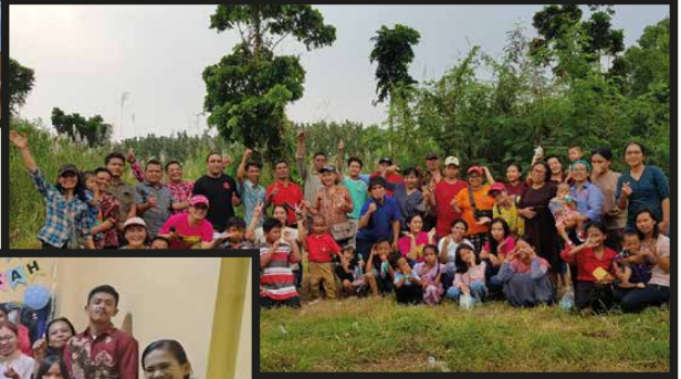
BIA Lingkungan Vincentius