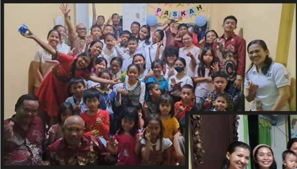
BIA Lingkungan Yohanes 23