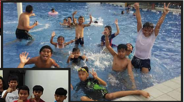
BIA Lingkungan Petrus & Lingkungan Teresia