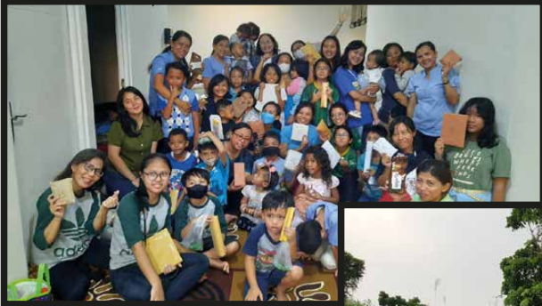
BIA Lingkungan Skolastika