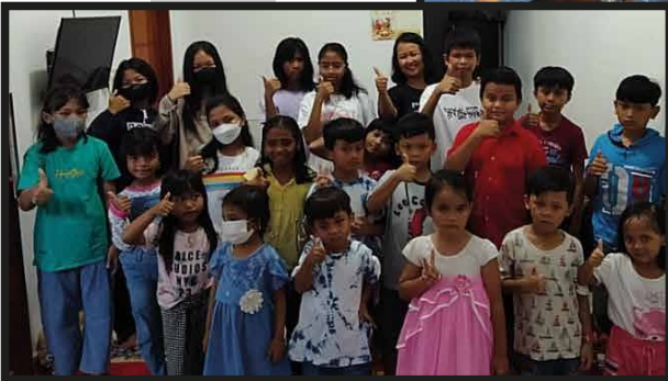
BIA Lingkungan Sisilia