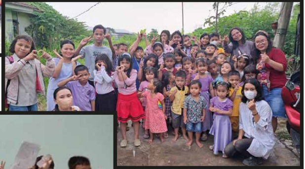
BIA Lingkungan Dominikus