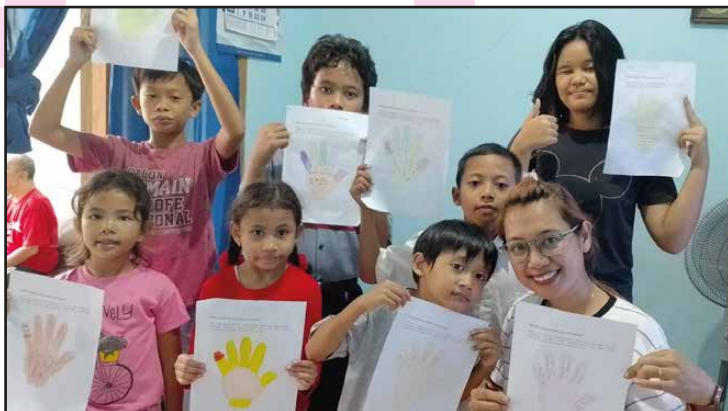
BIA Lingkungan Maria Magdalena