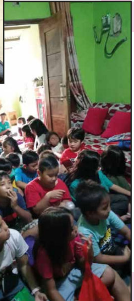
BIA Lingkungan Basillius Agung