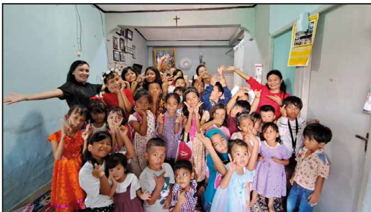
BIA Lingkungan Dominikus