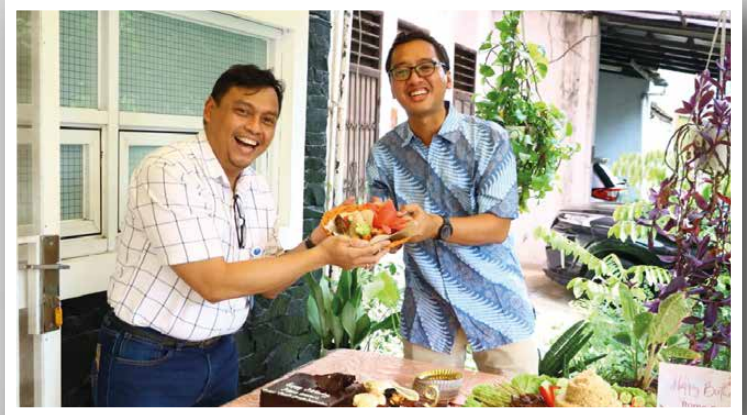
Potongan tumpeng untuk Sekretaris DPH