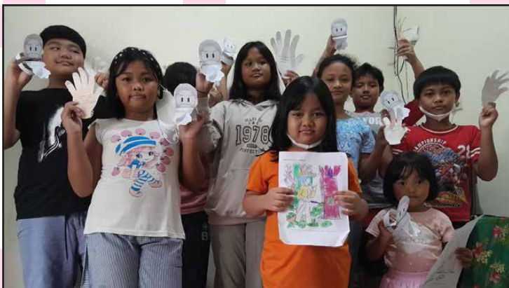
BIA Lingkungan Elisabeth