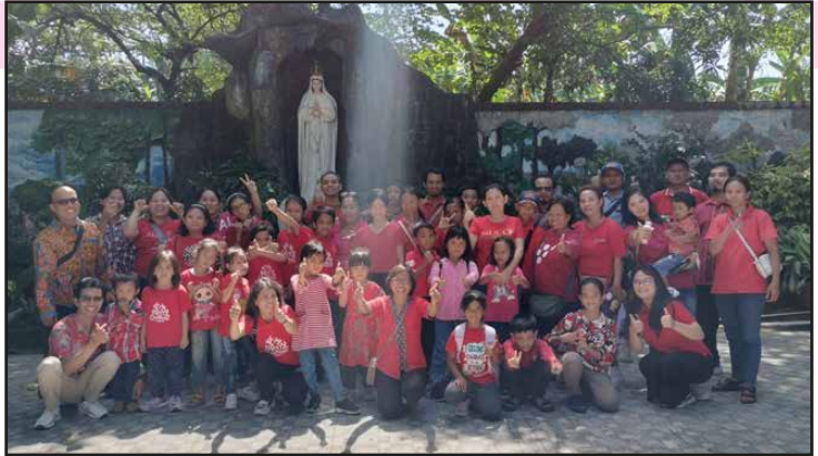
BIA Lingkungan Yohanes XXIII