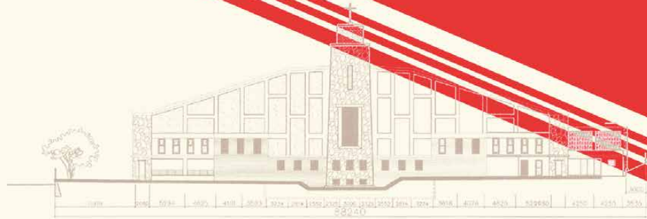
D2 TAMPAK BELAKANG KESELURUHAN SKALA 1:400