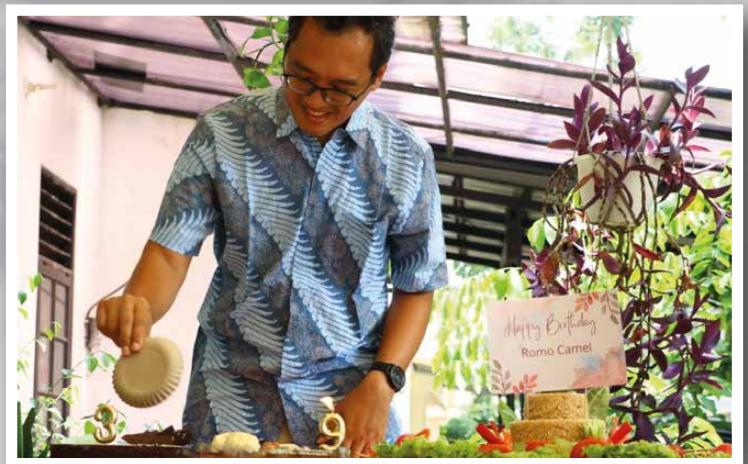
Meniup lilin (dengan dikipasi) 😊😊